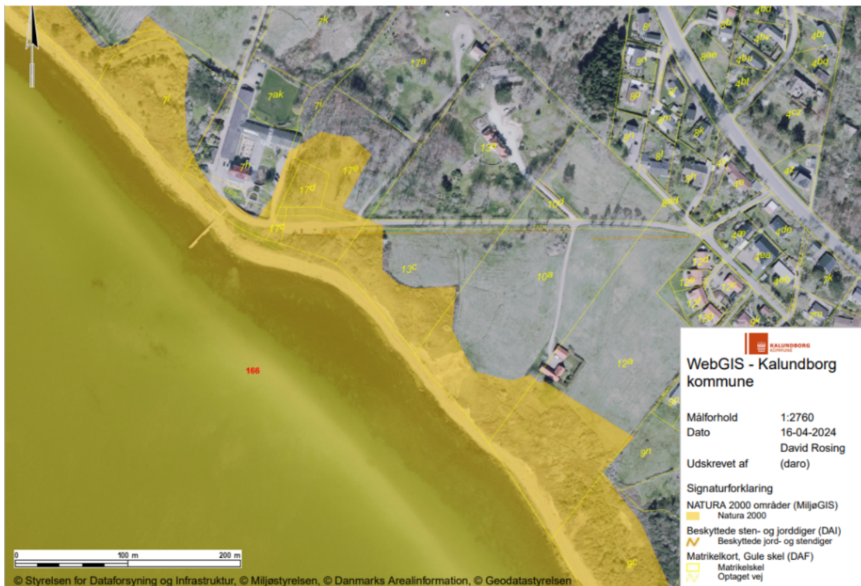
3 - Det ansøgte placering ift.de nærmeste Natura 2000-områder.

På grund af projektets matrikulære karakter vurderer vi, at det ansøgte ikke vil påvirke Natura 2000-området i sig selv eller i forbindelse med andre projekter.