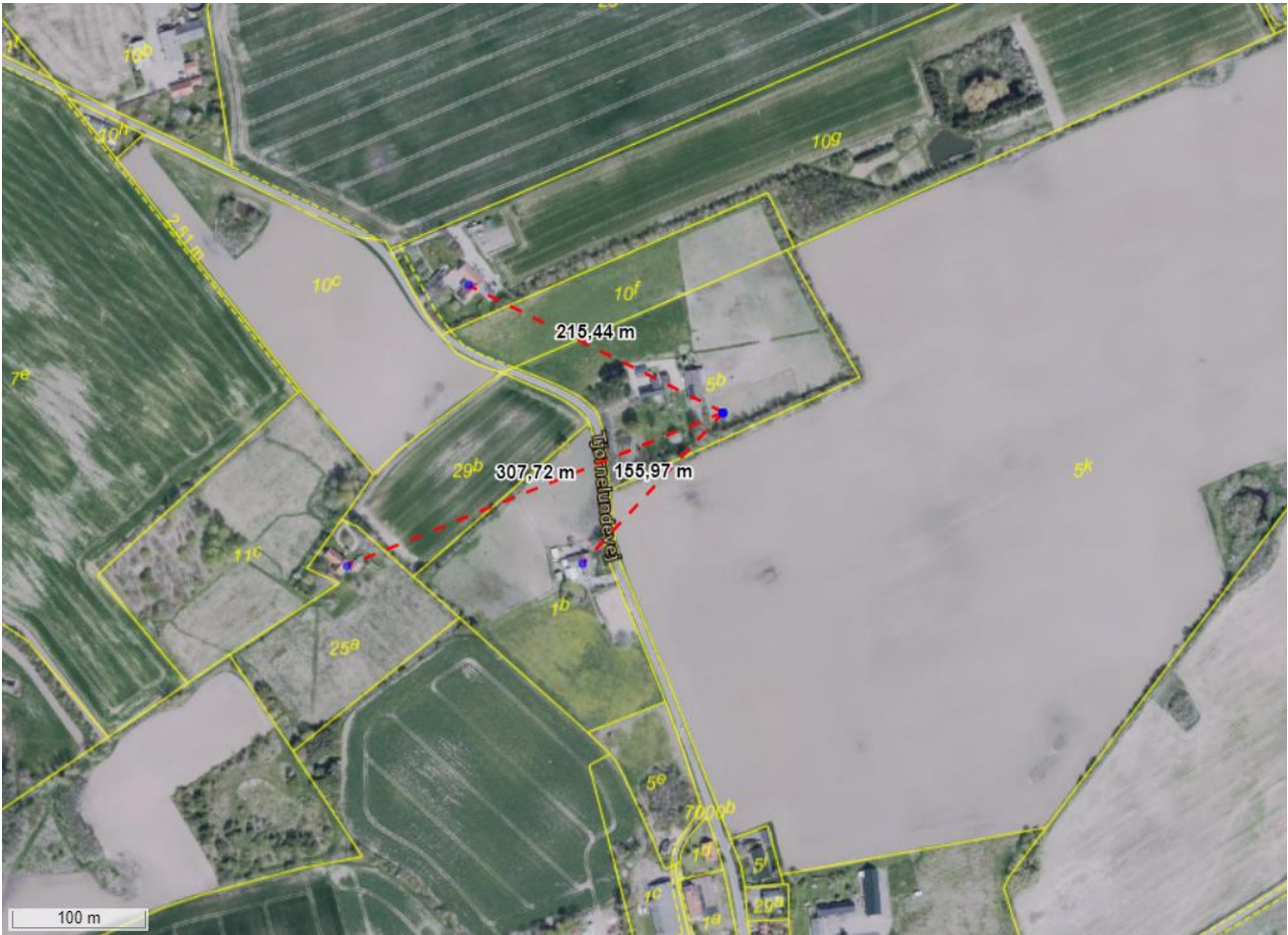
4 - Oversigtskort som viser placeringen af det ansøgte i forhold til omkringliggende naboer.