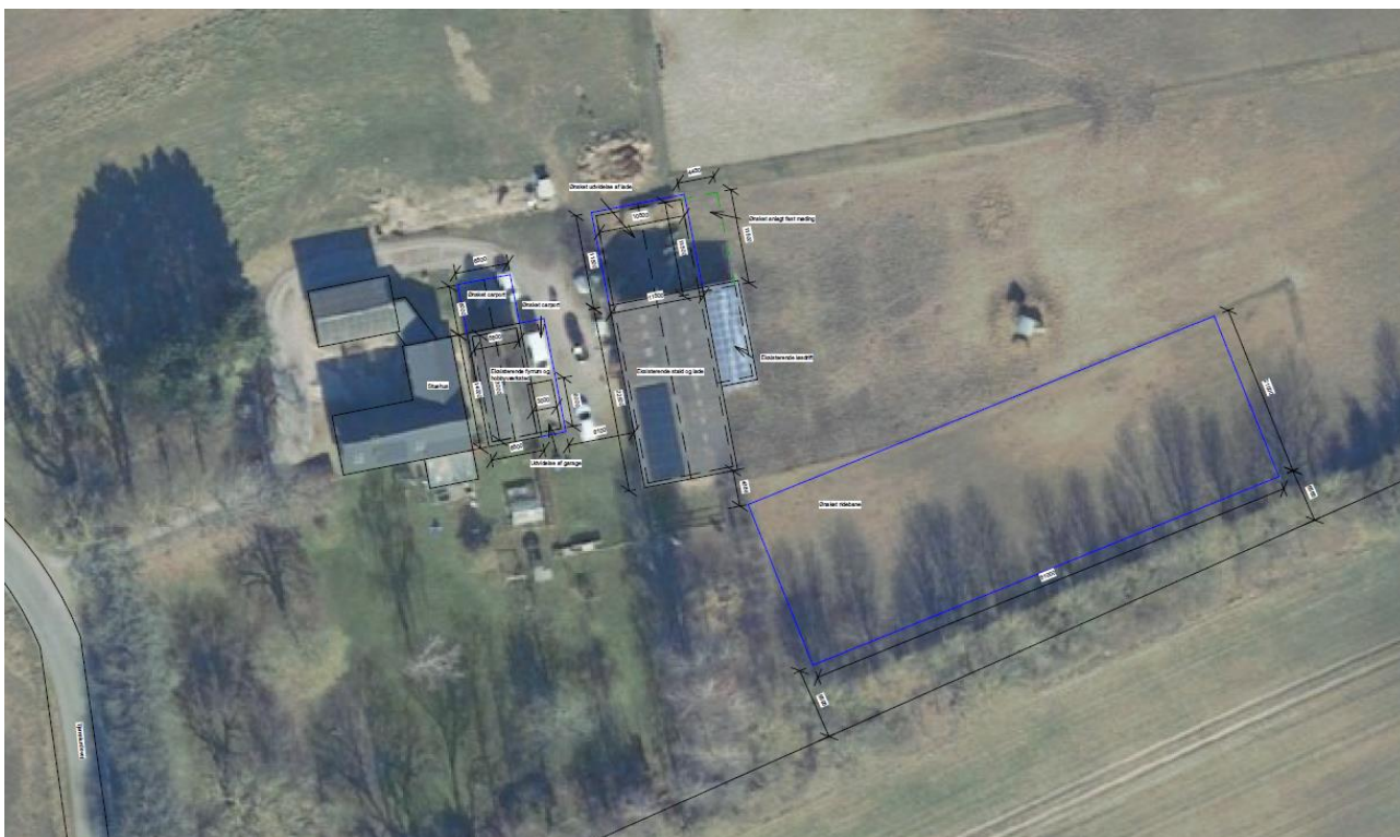
1 - Situationsplan som viser placeringen af ridebanen.

Desuden har du søgt om tilladelse til belysning på banen i form af et LED-bånd på 375 lm pr meter, som monteres i en skinne, med et vinklet profil på 45° (se billede 2), som fokuserer lyset ned mod ridebanens underlag. Lysbåndet monteres hele vejen rundt på hegnet i en højde på omkring 45 cm over underlagets overflade.