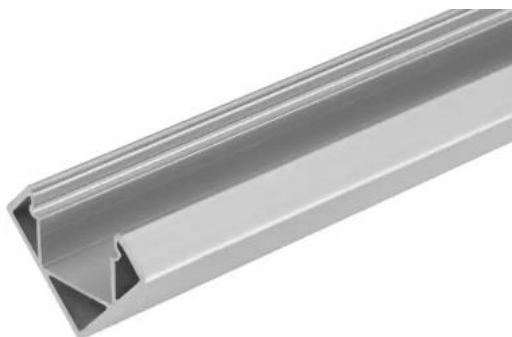
2 - Eksempel på monteringsskinne til LED-kantbåndsbelysning med et 45° profil.