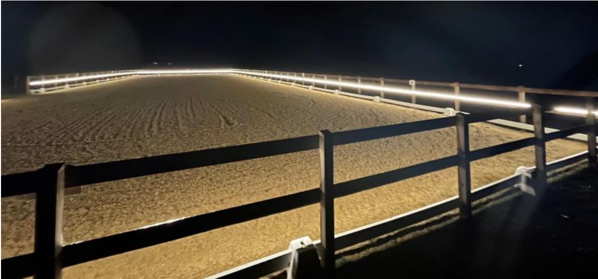
3 – Et indsendt referencebillede for LED-kantbånd, dog med en højere lumen pr meter og uden montering af monteringsskinne med 45° profil.