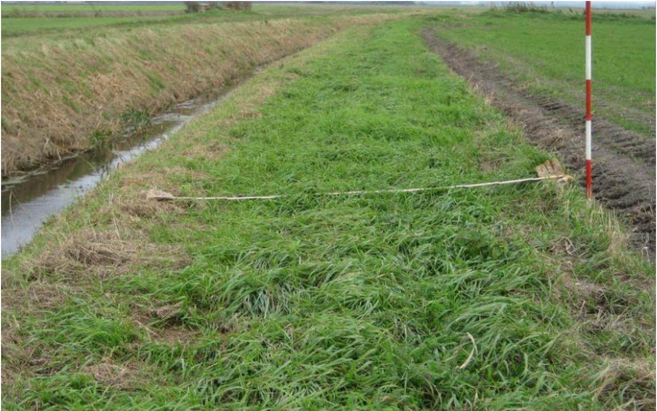
Figur 2 Korrekt udlagt dyrkningsfri 2 meter bræmme.