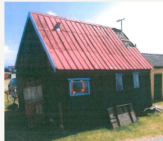
Det sorte Hus, anno 2012

"Fremme af turisme og fiskerierhverv på Sejerø, ved forbedring af havn og fiskerihavn"